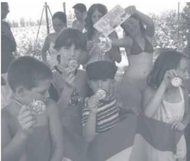
Campamento Juvenil de Verano en el Ashram de Alhama de Murcia.