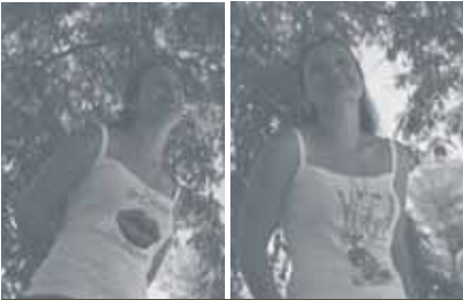
Nueva colección de camisetas pro-Karis.