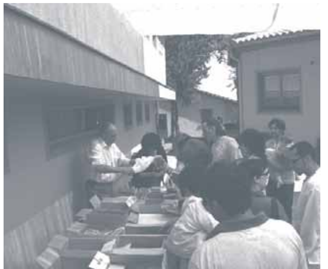
Mercadillo en el Ashram de San Martín de Valdeiglesias.