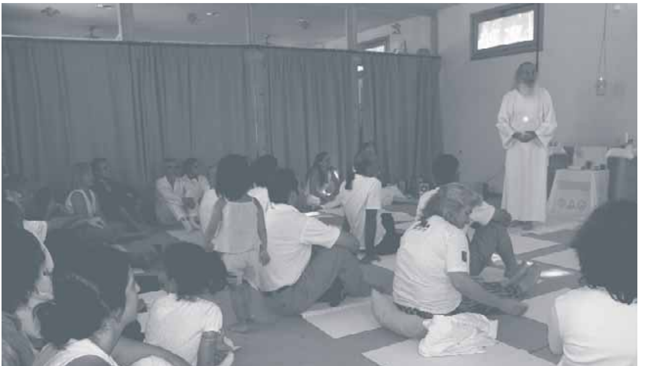
Jornadas Culturales con el Honorable Gurú José Marcelli en los Ashrams de San Martín de Valdeiglesias y Alhama de Murcia.