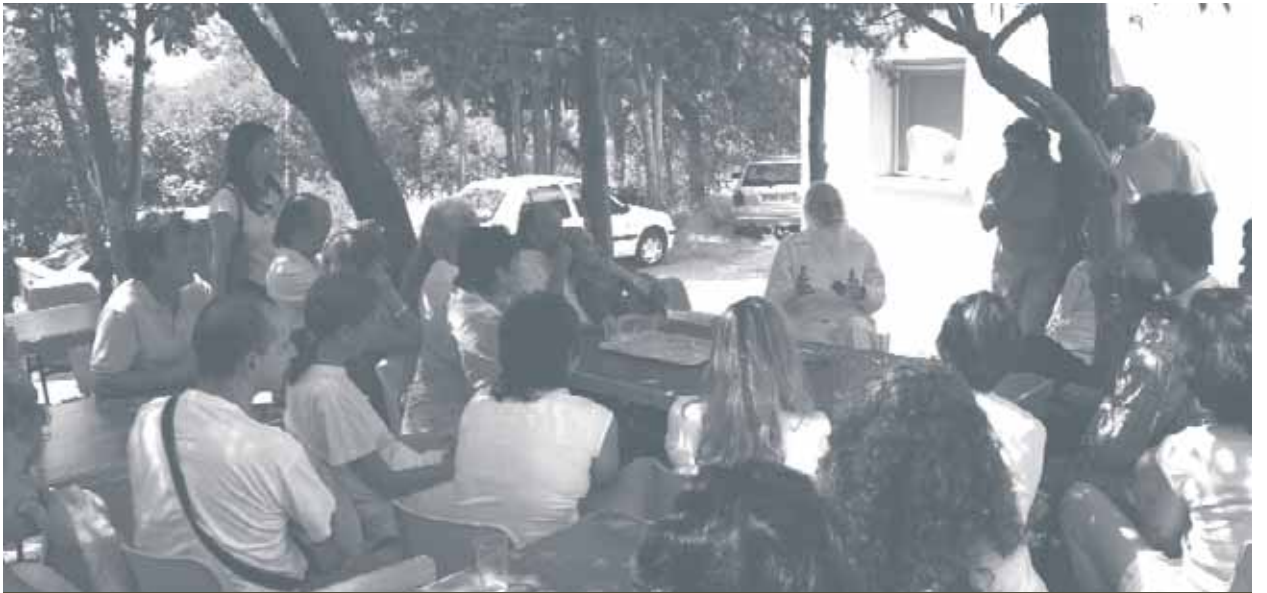
Jornadas Culturales con el Honorable Gurú José Marcelli en los Ashrams de San Martín de Valdeiglesias y Alhama de Murcia.